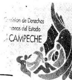
Mtra. Ligia Nicthe-Ha Rodríguez Mejía Presidenta de la Comisión de Derechos Humanos del Estado de Campeche

Oficio: PVG/410/2022/1341/Q-225/2019. C.c.p. Expediente: 1341/Q-225/2019. Rúbricas: LNRM / SBPZ / MABS.